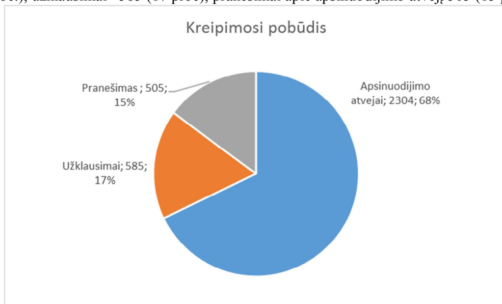
3 pav. Konsultacijų telefonu pobūdis pagal kreipimosi priežastį

Konsultacijų pobūdis pagal kreipimosi priežastį: apsinuodijimo atvejais kreiptasi 2304 kartus (68 proc.), užklausimai – 585 (17 proc), pranešimai apie apsinuodijimo atvejį 505 (15 proc.).