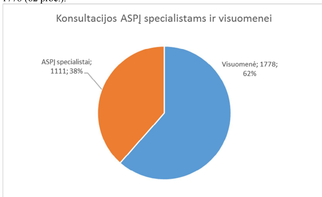
4 pav. Konsultacijų gyventojams ir ASPĮ specialistams santykis

Asmens sveikatos priežiūros įstaigų specialistai konsultuoti 1111 kartų (38 proc.), visuomenė – 1778 (62 proc.).